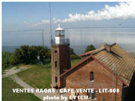
„Cape Ventef“ Litauen